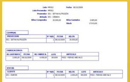
Consulta trazabilidad materia prima/aditivo